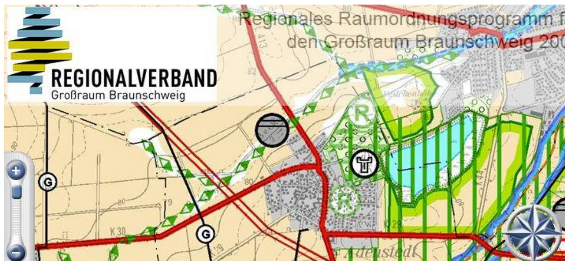
Ausschnitt aus dem Regionalen Raumordnungsprogramm 2008 (ohne Maßstab)

und besonderen Bedeutung möglichst nicht beeinträchtigt werden (III 2.1 (6)). Eine abweichende Nutzungsentscheidung der Gemeinde ist insofern begründet möglich.