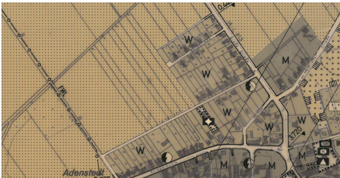
Ausschnitt aus dem Flächennutzungsplan für das Gebiet der ehemaligen Gemeinde Lahstedt (ohne Maßstab)

Gemäß § 8 Abs. 2 Satz 1 BauGB sind Bebauungspläne aus dem Flächennutzungsplan zu entwickeln. Die Gemeinde Ilsede besitzt aktuell zwei gültige Flächennutzungspläne, einen für das Altgebiet der Gemeinde Ilsede und einen für das Gebiet der ehemaligen Gemeinde Lahstedt. Der für Adenstedt geltende Flächennutzungsplan für das ehemalige Gebiet der Gemeinde Lahstedt stellt den Planbereich des Bebauungsplans für den Bereich südlich des Amselweges als Wohnbaufläche gem. § 1 Abs. 1 Nr. 1 BauNVO dar. Der nördlich der Straße gelegene Acker ist danach Fläche für die Landwirtschaft gem. § 9 Abs. 1 Nr. 18 a) BauGB.